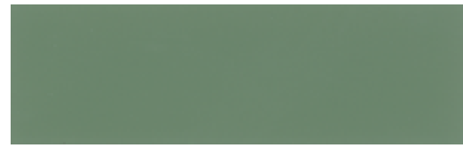
549 VERDE MAQUINARIA