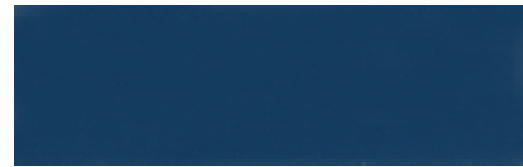
543 AZUL COBALTO