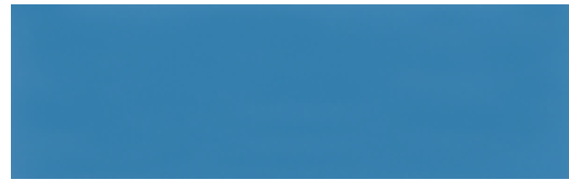
AZUL LUMINOSO RAL 5015